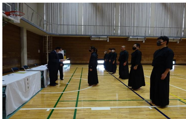
一級審査 合格証書授与